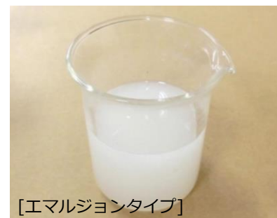
[エマルジョンタイプ]

スピード対応します!!! 購入、お見積り依頼、資料請求、ご相談、その他お問い合わせ お気軽にご連絡下さい