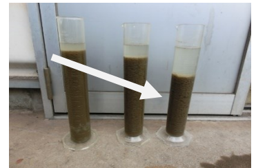
凝集・沈降スピードの増加