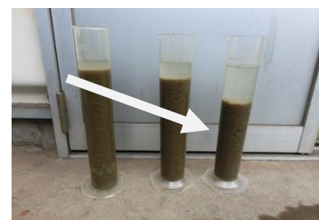
凝集・沈降スピードの増加